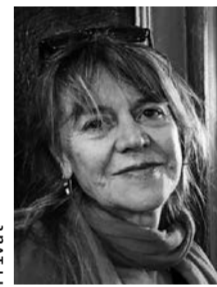
Marlen Reusser, Radsportlerin

«Als ich in die Schweiz kam, war ich zehn Jahre alt. Mein Vater, der uns damals am Bahnhof abholte, war schon dreizehn Jahre hier als Maurer und Saisonnier. Die lange Trennung hat uns entfremdet. Meine Eltern wurden nach unserer Ankunft oft gefragt, ob sie der Schweiz nicht dankbar seien. Es verhält sich umgekehrt: Die Schweiz sollte ihnen dankbar sein. Sie haben die Strassen gebaut, die Häuser geputzt, die Italianità in dieses Land gebracht. Darum müssen wir jetzt dagegen kämpfen, dass wir zum Saisonierstatut zurückkehren – und die Schweiz eine Gated Community für die Reichen wird.»