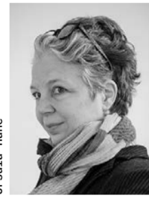
Carol Schuler, Schauspielerin («Tatort»)

«Eine Partei spricht dir wieder einmal die Luft ab, das Wasser, das Recht, die Infrastruktur zu nutzen, die du mit aufgebaut hast, für die du zahlst, für die du dich mitverantwortlich fühlst. Nach wie vielen seelenlosen, verlogenen Initiativen dieser Art ist eigentlich genug? Wie viele Verletzungen braucht es noch, bis du aufstehst, Widerstand leistest, nach wirklichen Lösungen suchst, für Probleme, die uns alle betreffen, die uns die Luft zum Atmen nehmen?»