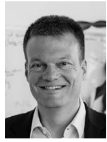
Martin Suter, Schriftsteller

«Die Chaos-Initiative gibt vor, ein Allheilmittel zu sein. In Wahrheit ist sie eine Bankrotterklärung. Die Schweiz verliert den Zugang zu den besten jungen Arbeitskräften und zu Forschungsprogrammen. Wir setzen die Beziehungen zu Europa aufs Spiel, die zentral sind für unseren Wohlstand und die Lösung der noch immer drängendsten Probleme unserer Zeit, den Klimaschutz und die Energieversorgungssicherheit.»